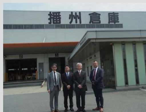
播州倉庫株式会社様 (詳しくは裏面をご覧ください)